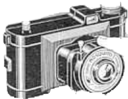
Fig. 2 - Pour les prises de vue

Pour la Montagne et la Mer par grande lumière, utiliser les écrans jaune ou orange, qui vous donneront des blancs plus purs et des lointains plus nets.